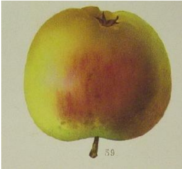
Vue A.Mas Le Verger 1869.

ORIGINE : Angleterre vers 1831. Semis d'un croisement de Ribston Pippin avec le pollen de Non Pareille. Introduite en France vers 1867 et longtemps présente dans les pépinières Leroy à Angers. Conservée à Brogdale (the book of apples , 1993 , p.262). Encore présente dans les années 1930 dans les pépinières Nomblot à Bourg-la-Reine. Décrite en 1927 dans le Catalogue de la Sté Pomologique de France , par J.Vercier p.304 en 1934 , par Le Verger Français 1947 , p.427. Ici nous voyons la description de André Leroy , 1873 , la plus fiable: